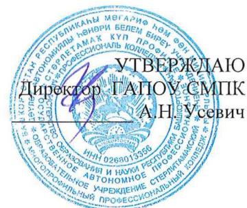
График промежуточной аттестации группы Д-315 специальности 54.02.01.Дизайн (по отраслям)