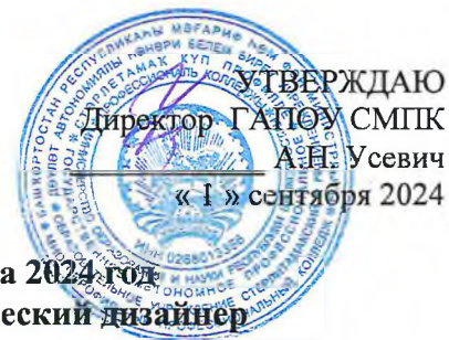
График промежуточной аттестации на 2024 год группы ГД-4-21 профессии 54.01.20 Графический дизайнер