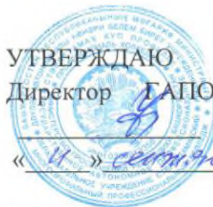
ГРАФИК ПРОМЕЖУТОЧНОЙ АТТЕСТАЦИИ