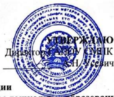
График сдачи промежуточной аттестации студентами группы СДО-46 специальности 44.02.04 Специальное дошкольное образование 1 полугодие 2023-2024 учебный год