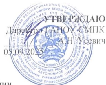
График сдачи промежуточной аттестации студентами группы СДО-16 специальности 44.02.04 Специальное дошкольное образование 1 полугодие 2025-2026 учебный год