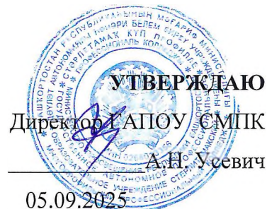
График промежуточной аттестации группы ПНК-40 специальности 44.02.02. Преподавание в начальных классах