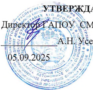
График промежуточной аттестации группы ПНК-21 специальности 44.02.02. Преподавание в начальных классах