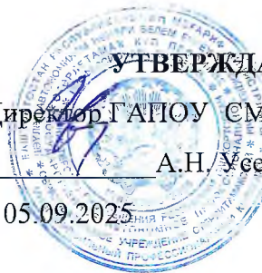
График промежуточной аттестации группы ПНК-11 специальности 44.02.02. Преподавание в начальных классах