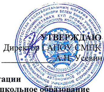
График сдачи промежуточной аттестации студентами группы ДО-27 специальности 44.02.01 Дошкольное образование