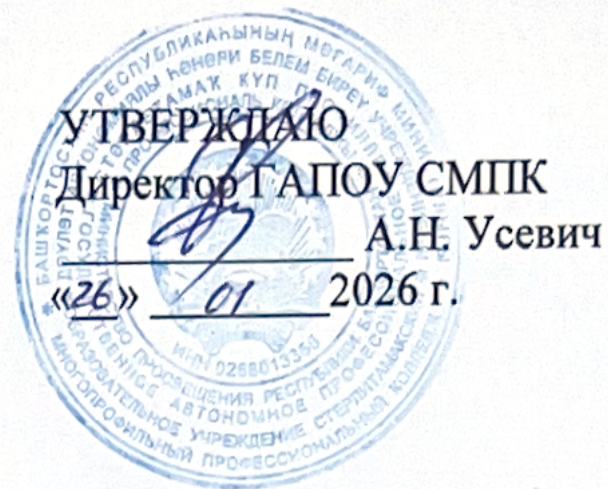
ГРАФИК ПРОМЕЖУТОЧНОЙ АТТЕСТАЦИИ группы ПД-219 специальность 40.02.02 Правоохранительная деятельность