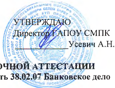
ГРАФИК ПРОМЕЖУТОЧНОЙ АТТЕСТАЦИИ группы БД-312 специальность 38.02.07 Банковское дело