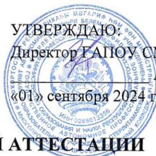
ГРАФИК ПРОМЕЖУТОЧНОЙ АТТЕСТАЦИИ

на первое полугодие 2024-2025 учебного года