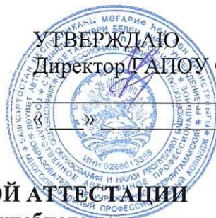
ГРАФИК ПРОМЕЖУТОЧНОЙ АТТЕСТАЦИИ на I полугодие 2024-2025 учебного года 09.02.07 Информационные системы и программирование Группа ИСП-311 (квалификация Программист)