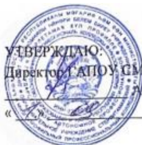
ГРАФИК ПРОМЕЖУТОЧНОЙ АТТЕСТАЦИИ на первое полугодие 2024-2025 учебного года 09.02.06 Сетевое и системное администрирование