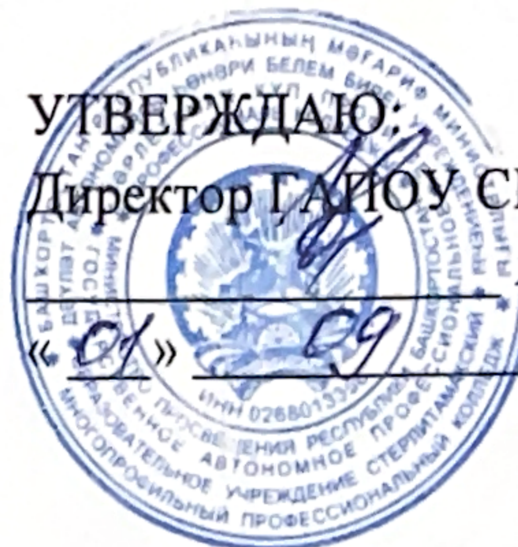
ГРАФИК ПРОМЕЖУТОЧНОЙ АТТЕСТАЦИИ на первое полугодие 2025-2026 учебного года 09.02.06 Сетевое и системное администрирование