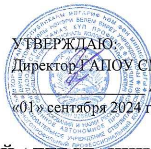
ГРАФИК ПРОМЕЖУТОЧНОЙ АТТЕСТАЦИИ на первое полугодие 2024-2025 учебного года 09.01.04 Наладчик аппаратных и программных средств инфокоммуникационных систем