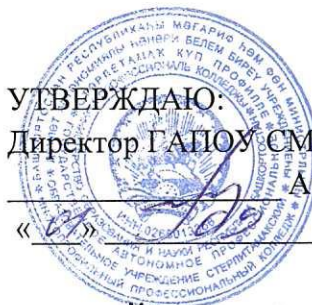
ГРАФИК ПРОМЕЖУТОЧНОЙ АТТЕСТАЦИИ

на первое полугодие 2023-2024 учебного года